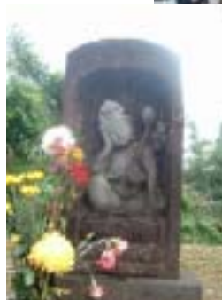
美しい表情の石像仏