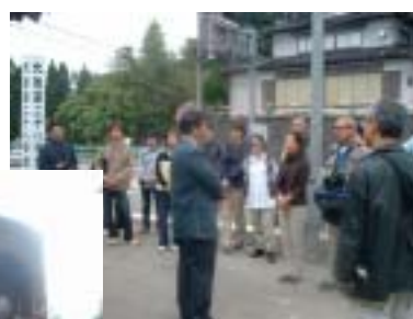
レクチャーを受ける