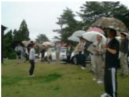
高多くんのレクチャー

レストラン「つくしんぼ」で、お昼ご飯のおこわおにぎりを食しながら、参加者と事務局の自己紹介を行い、しばらくの間、団らんしました。